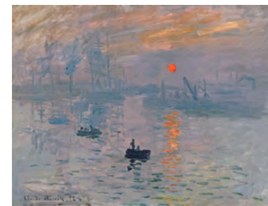
Claude Monet, Impression, soleil levant , 1872 Huile sur toile, 50 × 65 cm, Paris, Musée Marmottan Monet

2 boulevard Clémenceau - 02 35 19 62 62 muma-lehavre.fr