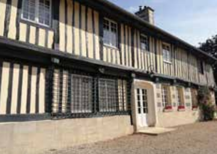
Hermeville, clos-masure de l'Herrière