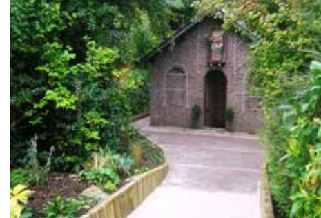
Rolleville, chapelle Sainte-Clotilde

🕒 45 min - Gratuit - Réservation obligatoire