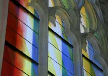
Harfleur, les vitraux de l'église Saint-Martin