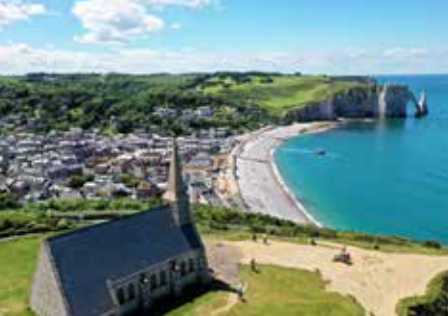
Les falaises d'Étretat