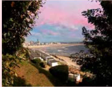
Le Havre, depuis les escaliers du Nice Havrais

🕒 2 h - Gratuit - Réservation obligatoire