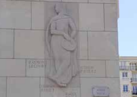
Le Havre, bas-relief de l'avenue Foch