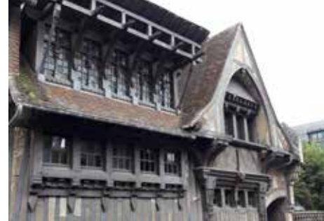
Étretat, atelier Charles Artus

Tous les mois, des visites vous proposent d'explorer différents secteurs de la communauté urbaine. Du petit hameau rural au quartier urbain en passant par les bourgs et les villages, venez (re)découvrir l'histoire et le patrimoine des lieux qui vous entourent, vous serez surpris par leur richesse et leur diversité. Ne manquez pas les formules théâtralisées à Saint-Vincent-Cramesnil et dans le quartier du Rond-Point au Havre ainsi que l'enquête urbaine proposée à Saint-Romain-de-Colbosc.