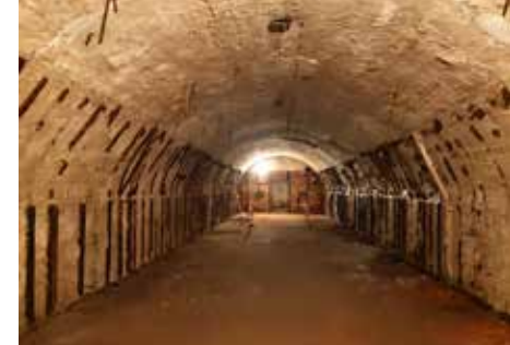
Le Havre, hôpital allemand

À partir de 7 ans - ⌚ 3 h - Tarifs : 5€ / 3€ Réservation : 02 35 24 80 01 ou communication@maisondelestuaire.org Bottes indispensables