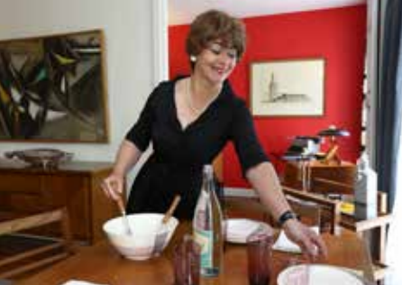
Appartement témoin Perret, A table avec Madame