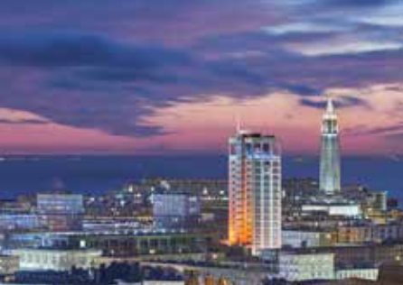
Le Havre de nuit