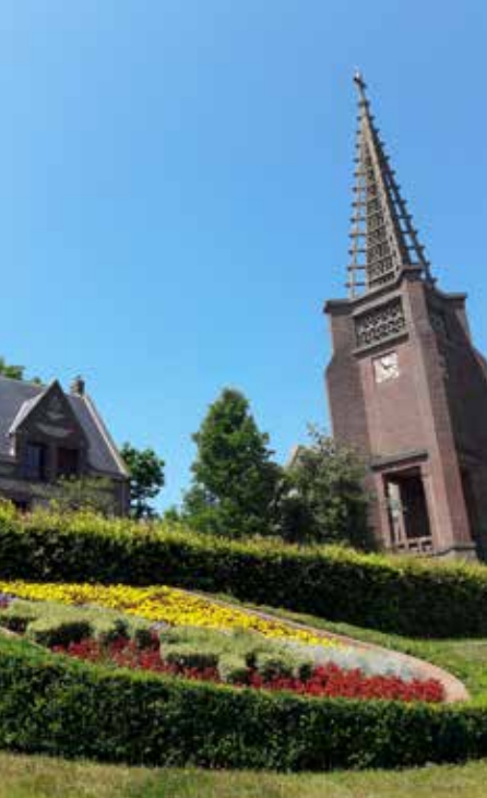
Fontaine-la-Mallet, église Notre-Dame de la pointe de Caux