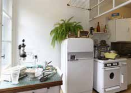
Le Havre, Appartement témoin Perret