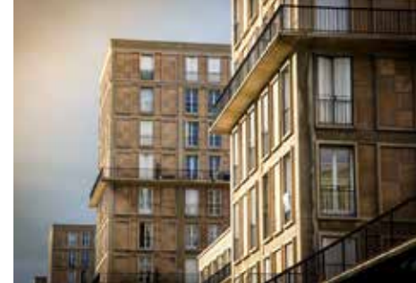
Le Havre, le centre reconstruit

Le 15 juillet 2005, le centre reconstruit par Auguste Perret était inscrit sur la Liste du patrimoine mondial par l'Unesco. Pour apprécier la valeur universelle exceptionnelle de cette ville résolument moderne, un ensemble de visites vous décrypte les spécificités de l'urbanisme et de l'architecture du maître du béton armé. Ne manquez pas les visites théâtralisées adaptées au jeune public dans l'Appartement témoin Perret et la nouvelle visite sur les bas-reliefs de l'avenue Foch !