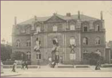
Cercle Franklin, Le Havre