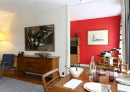
Appartement témoin Perret : le séjour, Le Havre