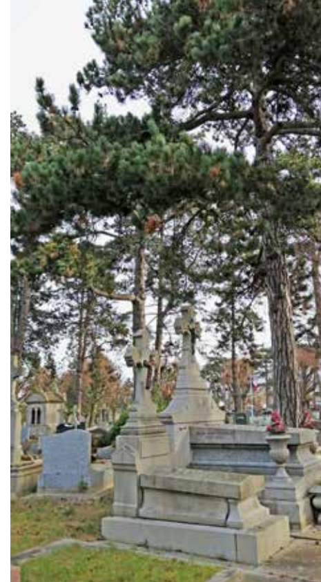
Cimetière Sainte-Marie, Le Havre

Accès par l'entrée située rue du 329 e RI, Le Havre