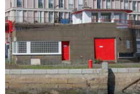
Poste de manœuvre du pont Notre-Dame, Le Havre