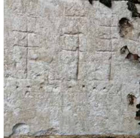
Graffiti marin, clos-masure de La Sauvagère, Le Tilleul

Le quartier des Neiges, une île dans la ville, Le Havre Dimanches 8 janvier et 26 mars, 14 h 30