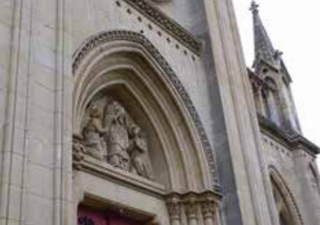
Eglise Saint-Denis, Sainte-Adresse

♿ Église Sainte-Jeanne d'Arc, Le Havre Samedi 5 novembre et dimanche 15 janvier, 14 h 30 et 15 h 30 Descriptif p. 8