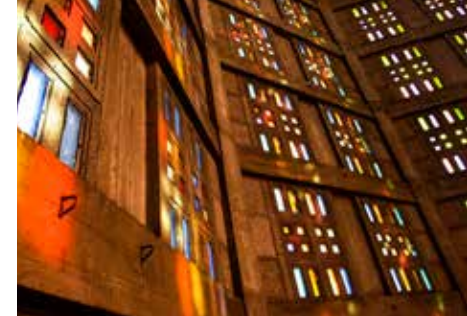
Église Saint-Joseph, Le Havre

RDV : Maison du patrimoine, 181 rue de Paris, Le Havre