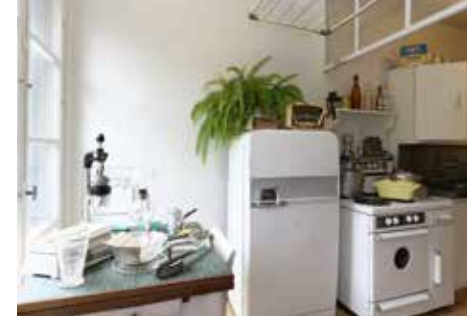
Appartement témoin Perret : la cuisine, Le Havre

L'appartement témoin Perret n'est pas accessible aux personnes à mobilité réduite.