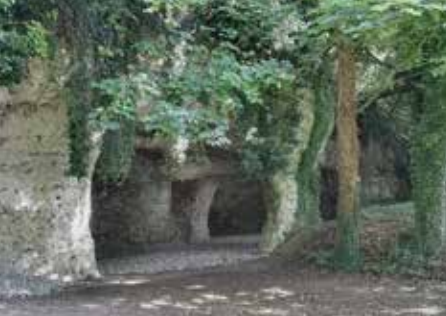
Grotte aux galets, Saint-Jouin-Bruneval