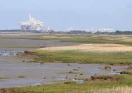
Réserve naturelle de l'estuaire, Sandouville