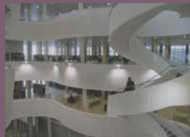
Bibliothèque universitaire, Le Havre