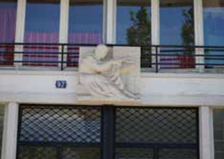
Bas-reliefs de l'avenue Foch, Le Havre