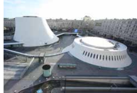
Le Volcan - espace Oscar Niemeyer, Le Havre

⌚ 1h30 - Gratuit - Réservation obligatoire : levolcan.com/billetterie