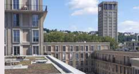
Terrasse végétalisée dans le centre reconstruit, Le Havre

🕒 2h le matin / 2h30 l'après-midi - Gratuit sur réservation avant le 13/10 - Accessible aux enfants de 12 ans et + accompagnés d'un parent. Matériel requis : un appareil photo numérique