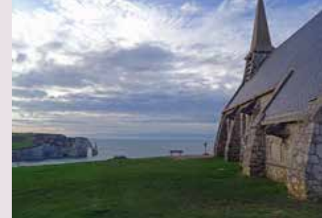
Vue depuis la chapelle Notre-Dame-de-la-Garde, Étretat

Gratuit - Visite libre aux heures d'ouverture de la Maison du patrimoine