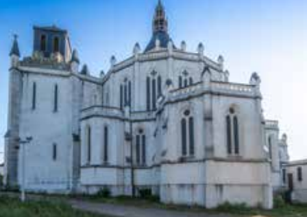
Eglise Sainte-Cécile, Le Havre