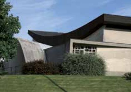
Église Sainte-Jeanne d'Arc, Le Havre