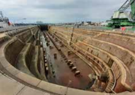
Formes de radoub du bassin de l'Eure, Le Havre