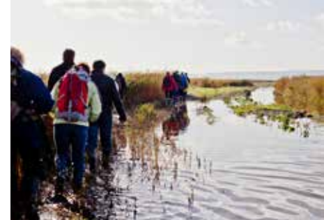
Réserve naturelle de l'estuaire, Sandouville

🕒 6h - 7 € / 5 €* - À partir de 10 ans Chaussures de marche et tenue adaptée obligatoires - Prévoir son pique-nique