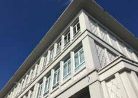
Ecole Jean Maridor, Le Havre