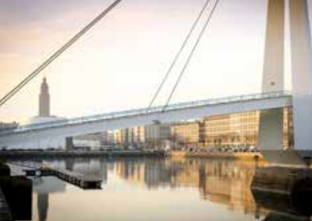
Bassin du Commerce, Le Havre