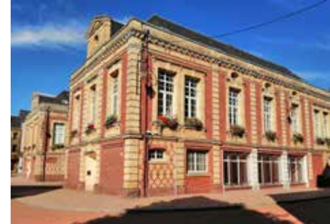
Place centrale, Saint-Romain-de-Colbosc