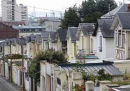
Cité havraise, Le Havre