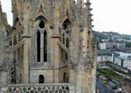
Clocher de l'église Saint-Martin, Harfleur