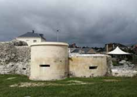
Porte de Rouen, Harfleur