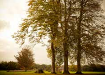
Plateau de Caux à l'automne