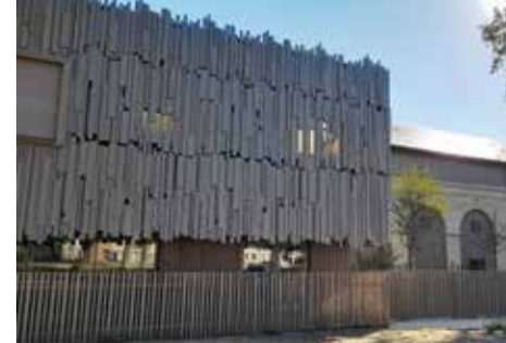
Crèche Jeanne Tranchard, Le Havre

La 7 e édition des Journées nationales de l'architecture invite le public à découvrir des réalisations récentes et innovantes à travers une riche programmation de rencontres avec les professionnels de l'architecture.