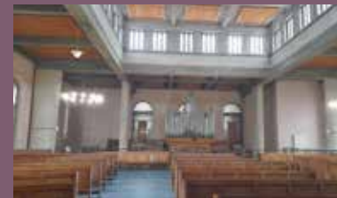
Temple protestant, Le Havre

🕒 1h30 - 4 € - Réservation en ligne sur : billetterie.abbaye-montivilliers.fr