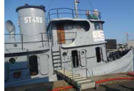
USST 488, Le Havre

🕒 1h30 - Gratuit sur réservation : 02 35 13 30 09 - Musée du Prieuré - 50, rue de la République