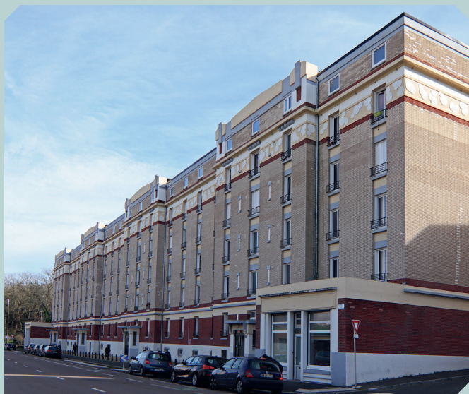
Habitation à Bon Marché de Tourneville, 1932 Le Havre, 16-22 rue Louis Blanc