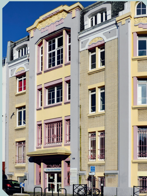
Siège de la société de la Défense Civile, 1930 Le Havre, 2 rue Léon Gautier