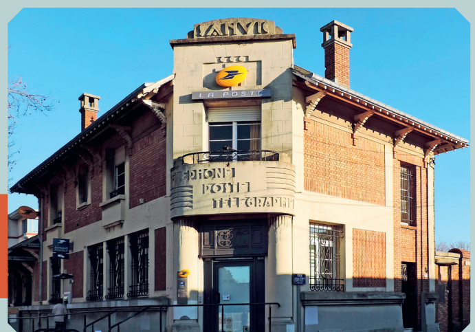
Bureau de poste de Sanvic, 1937, en collaboration avec Maurice Combe Le Havre, place Raymond Poincaré