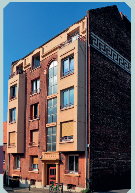
Immeuble résidentiel, 1934 Le Havre, 7 rue Auguste Dollfus