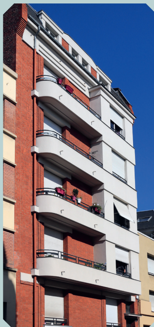
Immeuble résidentiel, 1933 Le Havre, 99 rue Lesueur