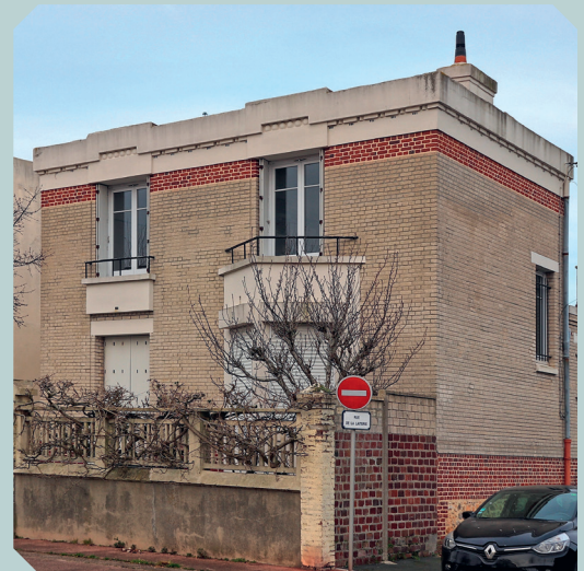
Maison individuelle, 1932 Le Havre, 9 avenue de Frileuse