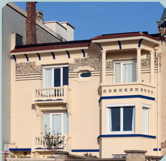
Villa, 1923 Le Havre, 46 bis boulevard Albert 1 er