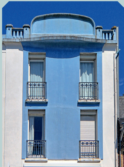
Majesty Hôtel, avant 1930 Sainte-Adresse, 22 rue du Roi Albert